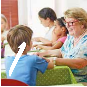
1 VERSICHERUNGSSCHUTZ IM EHRENAMT Seite 4