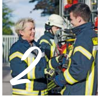
2 UNFALL- VERSICHERUNG Seite 10